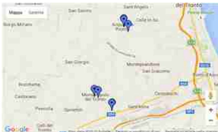
Dislocazione generale dei plessi